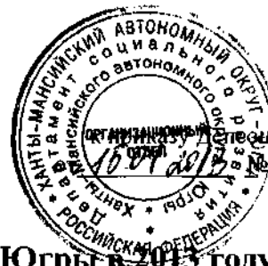
График проведения Депоцразвития Югры в 2013 году выездных проверок деятельности органов опеки и попечительства